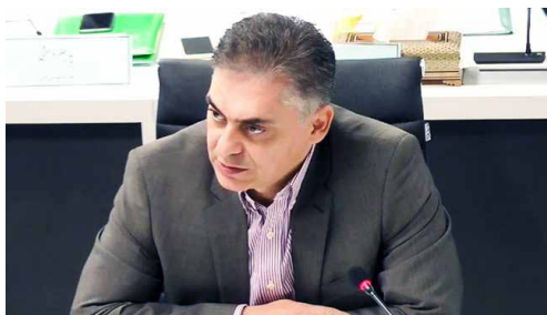
رئیس کنفدراسیون صادرات ایران خبر داد

وی خاطر نشان کرد: صادرکنندگان با مشکلاتی که در عرصه تعهد ارزی به وجود می‌آید عملاً بخشی از توان خود را از دست می‌دهند و همین موضوع ظرفیت تولید با محوریت صادرات را تحت الشعاع قرار می‌دهد. از سوی دیگر به وجود آمدن اختلاف میان صادرکننده و وارکننده نیز چالش دیگری است که می‌تواند برای ما مشکل آفرین شود.