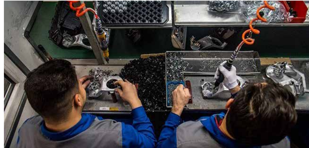
گزارش پایگاه خبری اتاق ایران به مناسبت روز ملی بهره‌وری

همچنین بر اساس اعلام سازمان ملی بهره‌وری، به طور میانگین کشورهای آسیایی عضو APO در دوره زمانی ۲۰۱۰ تا ۲۰۱۷ سهم ۳۰ درصدی از رشد اقتصادی را از محل بهره‌وری تجربه کرده‌اند، حال آنکه از ۲،۲ درصد رشد اقتصادی در ایران، سهم عمده (حدود ۷۵ درصد) حاصل سرمایه‌گذاری