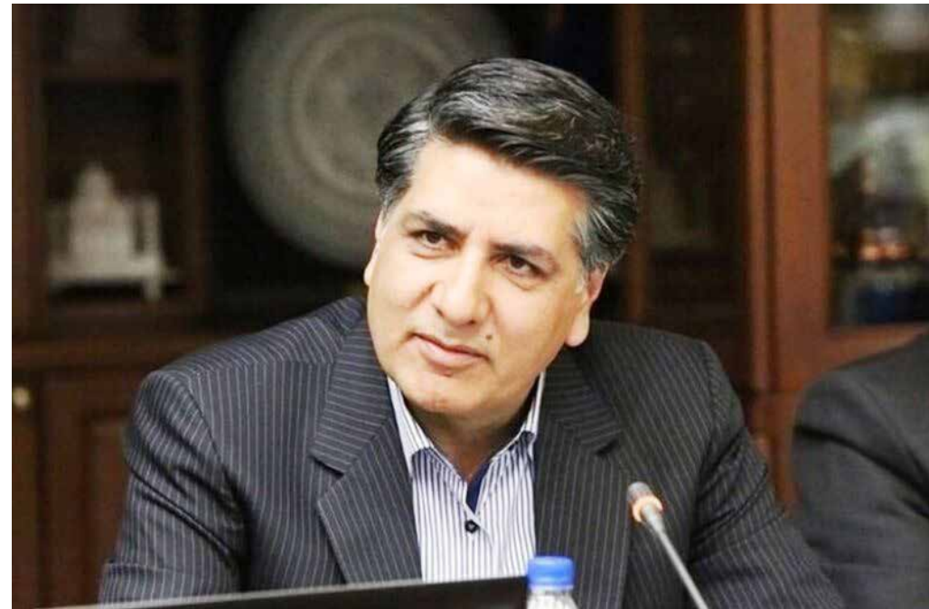
معاون هماهنگی توزیع شرکت توانیر: