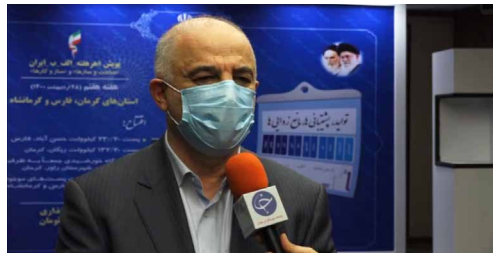
معاون وزیر نیرو در امور برق و انرژی مطرح کرد؛

او در پایان گفت: خوشبختانه ما در منطقه‌ای قرار گرفته ایم که پیک مصرف به طور مثال در کشورهای شمالی با کشورهای غرب، با هم متفاوت است. همچنین با تمام کشورهای همسایه مانند افغانستان، پاکستان، عراق و ارمنستان تجارت برق داریم.