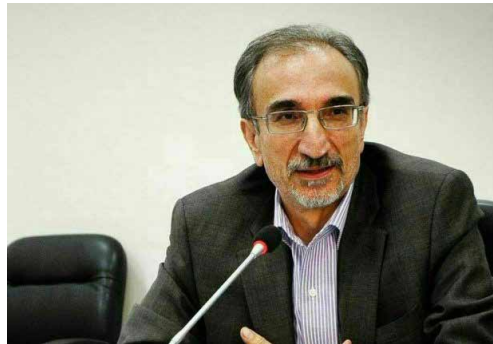
معاون وزیر نیرو:

این مقام مسئول با اشاره به اقدام‌های انجام شده در این چارچوب اعم از نشست‌هایی با وزرای سابق نیرو و استادان دانشگاه‌ها، ادامه داد: این اقدام‌ها منتج به ساختار جدیدی شد که در آن رکن اصلی گروه‌های آبی است. با تصویب ساختار در سازمان استخدامی، در نخستین اقدام برای انتخاب رؤسای حوزه آبریز طی فراخوانی ۹۶ نفر برای ۹ پست شرکت کردند که از این تعداد، بیش از ۳۰ نفر وارد مرحله مصاحبه و در نهایت ۹ نفر انتخاب شدند. حدود ۸۰ مدیر در این مدت انتخاب و مستقر شده‌اند و کار خود را شروع کرده‌اند که سوابق و شرایط لازم را دارند. کارها هم به خوبی پیش می‌رود آشکالاتی هم هست که این‌ها هم برطرف می‌شود.