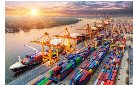
بسته سیاستی برگشت ارز صادراتی ابلاغ شد

بر اساس این مصوبه، روش‌های برگشت ارز حاصل از صادرات نیز به طرق، فروش ارز در سامانه نیما، واردات در مقابل صادرات خود، واگذاری ارز حاصل از صادرات به غیر، بازپرداخت بدهی تسهیلات ارزی و فروش ارز به صورت اسکناس به بانک‌ها و صرافی‌های مجاز، تعیین شده‌است.