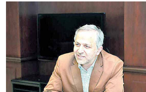
باید و نبایدهای چارچوب جدید نظام بانکی بررسی شد