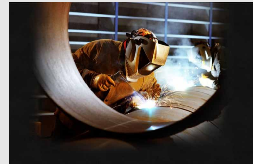
سختگویی صنعت برق خبر داد:

سختگویی صنعت برق با بیان اینکه با اجرای این مصوبه شرکت های تولیدکننده می توانند برق تولیدی خود را به صورت نقدی بفروشند و سرعت نقدشوندگی درآمدهای خود را افزایش دهند، خاطرنشان کرد: این مصوبه کمک خواهد کرد تا میزان سرمایه گذاری ها در صنعت برق افزایش یابد.