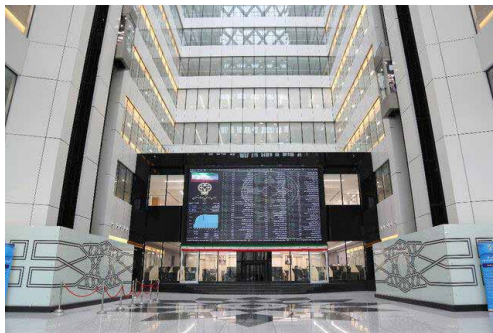
معاونت کسب‌وکار اتاق تهران تحلیل کرد

بر اساس تحلیل کارشناسان معاونت کسب‌وکار اتاق تهران، اطلاعات مربوط به سهم صنایع گوناگون از ارزش کل بازار بورس و فرابورس نشان می‌دهد که تغییر در ارزش ده صنعت نخست، می‌تواند به تنهایی بر تغییر ارزش سایر ۳۹ صنعت دیگر سایه افکند.