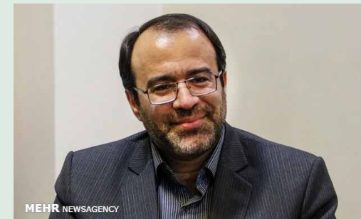
در گفتگو با مهر مطرح شد:

طغیانی گفت: بر اساس بررسی‌های کارشناسی صورت گرفته، قانون جدید چک تعداد چک‌های برگشتی را به لحاظ تعداد و ارزش نسبت به قبل از اجرای قانون کاهش داده است که این موضوع اهمیت بالای قانون جدید چک را نشان می‌دهد.