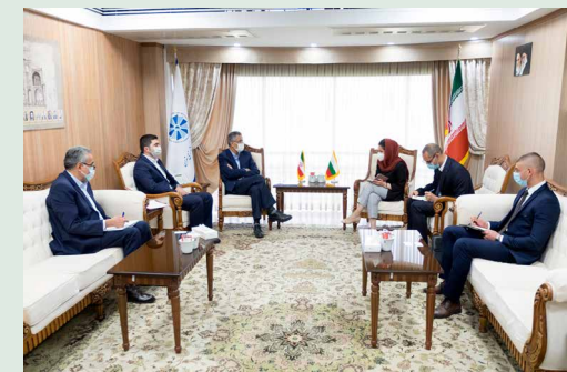
در ملاقات سفیر بلغارستان در ایران با رئیس اتاق تهران مطرح شد

معاون بین الملل اتاق تهران نیز در این دیدار طی سخنانی با اشاره به اینکه یکی از زمینه‌های مناسب همکاری، خدمات فنی و مهندسی است، افزود: به دلیل ارتباطاتی که اتاق تهران با نظام مهندسی استان تهران دارد، می‌تواند، شرکت‌های معتبر ایرانی در این حوزه را برای حضور در پروژه‌های ساخت و ساز یا برای انتقال تجربیات فنی و مهندسی به بلغارستان معرفی کند. به گفته وی، اتاق تهران این اقدام را در ارتباط با کشورهای