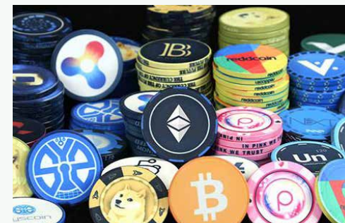
پورا ابراهیمی مطرح کرد:

رئیس کمیسیون اقتصادی مجلس تأکید کرد: همه این مسایل موجب شکل‌گیری فضایی کاملاً مبهم در شرایط کنونی شده است، متأسفانه هیچ برنامه و دستورالعمل مشخصی در کشور برای تبدیل این ظرفیت به قوت در اقتصاد ملی وجود ندارد.