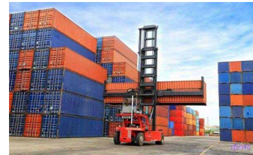
برای جلوگیری از افزایش قیمت‌ها

به گزارش ایسنا، بر اساس اطلاعات منتشر شده از سوی گمرک، وزارت صنعت، معدن و تجارت (صمت) چندان ندراد.