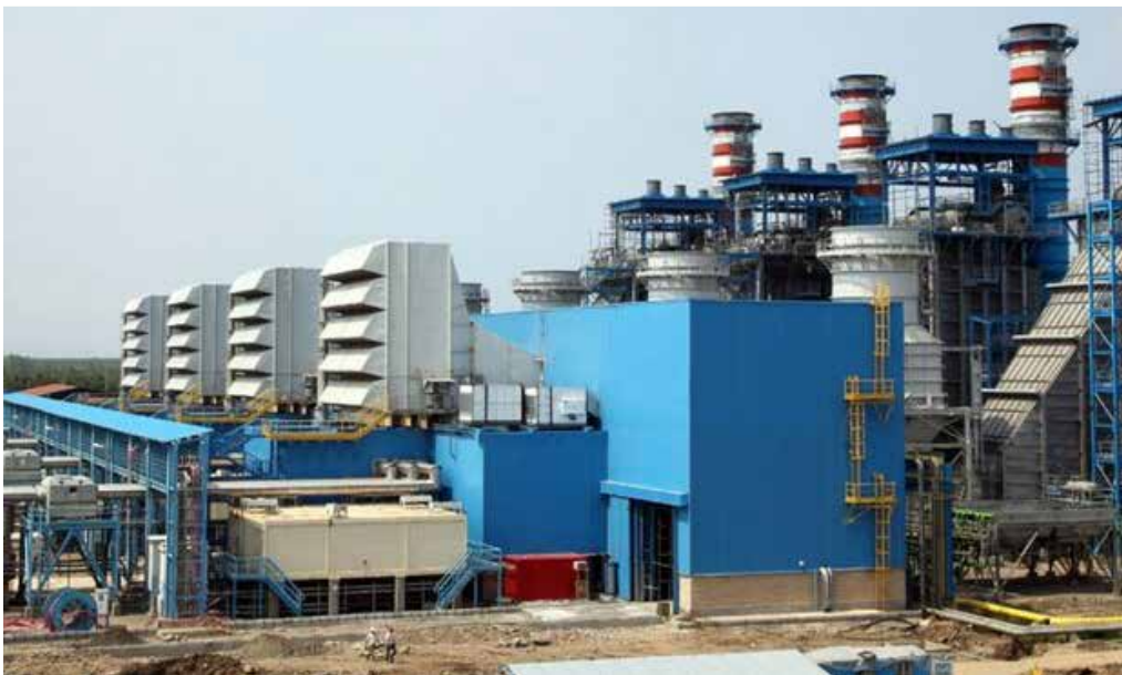
مدیرعامل شرکت برق حرارتی خبر داد: