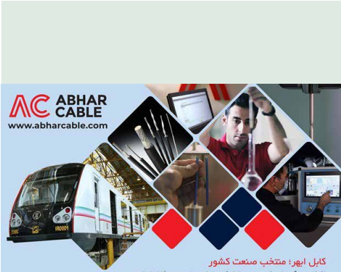
کابل ابره: منتخب صنعت کشور

افخاری دیگر برای نخستین و تنها شرکت دانش بنیان صنعت کابل ایران و ایست تولید کابلهای واگن جهت شرکت در نخستین پروژه ساخت قطار مترو ملی کابل ابره در پروژه ساخت نخستین قطار مترو ملی به همراه ۱۷ شرکت دانش بنیان دیگر و شرکتهای بزرگ صنعتی از جمله شرکت واگن سازی تهران، جهاد دانشگاهی، مینا لوکوموتیو و تیوان ترمز مشارکت نمود. طراحی و ساخت قطار مترو ملی با حمایت معاونت علمی و فناوری ریاست جمهوری، صندوق شکوفایی و نوآوری در مدت ۱۸ ماه و با هدف ارتقا نومی سازی از ۳۰ به بیش از ۸۰ درصد صورت پذیرفت.