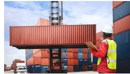
جمشیدنفر، رئیس کمیسیون توسعه صادرات غیرنفتی اتاق ایران: