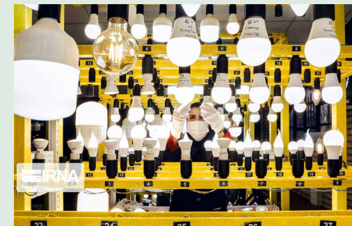
سخنگوی صنعت برق اعلام کرد:

از همه هموطنان گرانقدر درخواست می‌شود با کاهش مصرف برق و گاز، پرسنل صنعت برق را در استمرار تأمین انرژی به ویژه در مناطق سردسیر کشور یاری کنند.