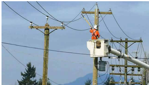
برای اولین بار

به گزارش پایگاه اطلاع رسانی سازمان بورس، قرارداد سلف یا عقد سلف قراردادی است که در آن عرضه‌کننده بخشی از دارایی پایه را به ازای بهای نقد و مطابق قرارداد سلف به فروش می‌رساند تا در دوره تحویل به خریدار تسلیم کند.