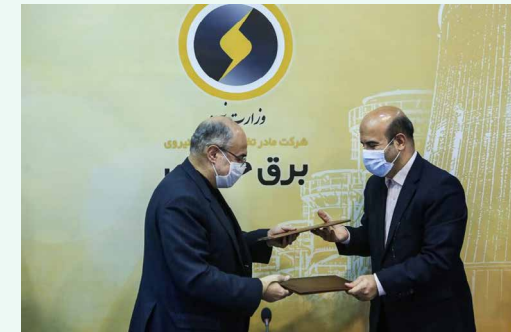
میان شرکت برق حرارتی و فراب؛

مدیرعامل شرکت برق حرارتی افزود: با احداث این واحد بخار سالانه بیش از ۱۹۰ میلیون مترمکعب در مصرف سوخت گاز طبیعی نیز صرفه‌جویی خواهد شد.