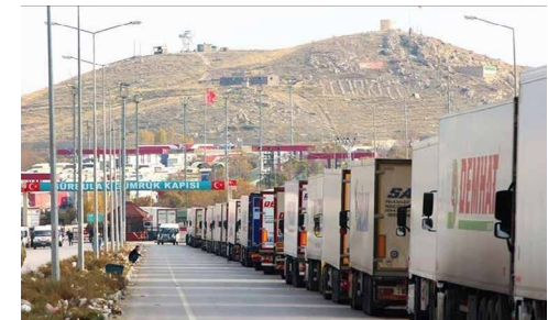
مدیرکل گمرک مرزی بازرگان خبر داد:

به گفته مدیر کل گمرک بازرگان، کامیون‌های حامل بار فاسدشدنی در اولویت خروج از مرز قرار دارند و تلاش می‌شود این مشکل ظرف چند روز آینده برطرف شود. او با اشاره به اینکه هم‌اکنون تمام نیروهای انتظامی، مرزبانی و نیروهای گمرکی در پایانه مرزی حضور دارند و تلاش می‌شود بدون کوچک‌ترین مشکل، صف کامیون‌ها برطرف شود، افزود: هیچ‌گونه مسئله امنیتی و جانی کامیون‌داران و محموله کامیون‌های آنها را طی مسیر منتهی به گمرک تهدید نمی‌کند.