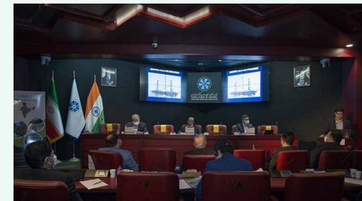
با حضور سفرا و نمایندگان خارجی و مقام‌های دولتی در نشست اتاق بازرگانی تهران تشریح شد

بندری برای اشاعه صلح و فقرزدایی در منطقه دبیرکل اتاق تهران نیز در این نشست، در سخنانی،