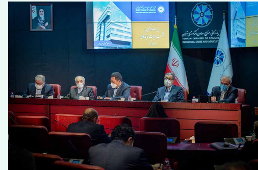
بیست و یکمین نشست هیات نمایندگان اتاق بازرگانی تهران برگزار شد