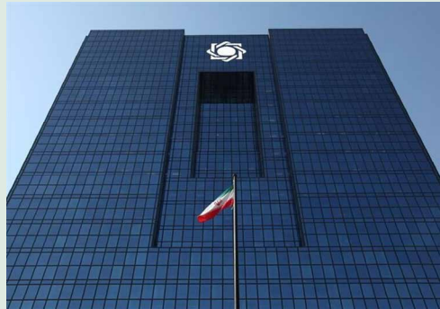
بانک مرکزی اعلام کرد

سرمایه گذاران در واحد زمان حتی بیش از نقاط نزدیک ما می توانند در ایران تولید انرژی داشته باشند. اردکانیان ادامه داد: ایران مناطق مطالعه شده پهناوری برای استفاده از انرژی خورشیدی و تونل های بادی دارد، مهمترین مناطق برای استفاده از انرژی باد در مناطق مرزی افغانستان است که در روزهای اخیر اجلاس سه جانبه ای با افغانستان و آلمان برای جذب سرمایه گذاری برگزار شد که از دانش فنی و نیروی انسانی ایران استفاده شود. وی خاطر نشان کرد: در این پروژه برای ظرفیت تا حدود ۳۰ هزار مگاوات استفاده از انرژی بادی از سرمایه گذاری خارجی استفاده خواهد کرد حتی کشورهایی که منابع سوخت های فسیلی قابل ملاحظه ای دارند به دنبال سرمایه گذاری بر روی تجدیدپذیرها هستند چراکه آینده انرژی دنیا در این بخش است؛ قطعاً ما هم باید از این فرصت استفاده کنیم. وزیر نیرو از ایجاد گشایش در روابط و مقررات توسعه تجدیدپذیرها خبر داد و خاطر نشان ساخت: طی همین روزها و قبل از پایان سال تلاش می شود به لحاظ ضوابط مقررات گشایش بیشتری در این زمینه ایجاد شود تا توجه مناسب تری به سرمایه گذاری در تجدیدپذیرها رخ دهد. وی درباره وضعیت صادرات برق به افغانستان بعد از انفجارهای اخیر در مرز دو کشور گفت: به دلیل آتش سوزی ها شبکه برق آسیب دید اما مشکل جدی نیست. تا حدی که تعهد صادرات داشتیم امکان صدور انرژی فراهم است. وی با بیان اینکه ما به دنبال توسعه امکان تبادل برق با افغانستان هستیم از آغاز مذاکرات برای توسعه صادرات برق به این کشور خبر داد. وزیر نیرو ابراز امیدواری کرد که در آینده نزدیک مذاکرات ما تبدیل به قرارداد بلندمدت شود تا بتوانیم با توجه به طولانی قرارداد توجیه بیشتری برای سرمایه گذاری احداث خط انتقال داشته باشیم.