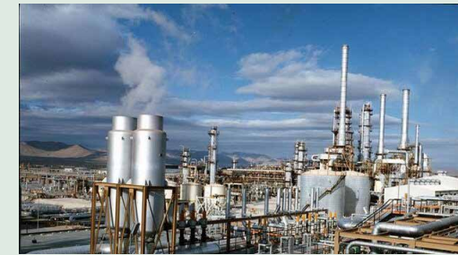
مهر گزارش می‌دهد؛