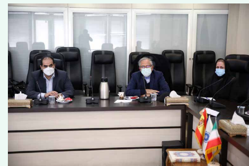
در نشست کمیسیون فاوا و اتاق مشترک ایران و اسپانیا مطرح شد

ای نمایشگاه از ۵ اسفند سال جاری آغاز به کار کرده است و بر اساس اعلام مسئولان نمایشگاه ۳۰ ام فروردین ماه سال ۱۴۰۰ به طور رسمی افتتاح می‌شود و تا ۵ خرداد سال آینده ادامه خواهد داشت.