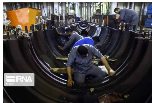
سخنگوی صنعت برق در گفت و گو با ایرنا؛