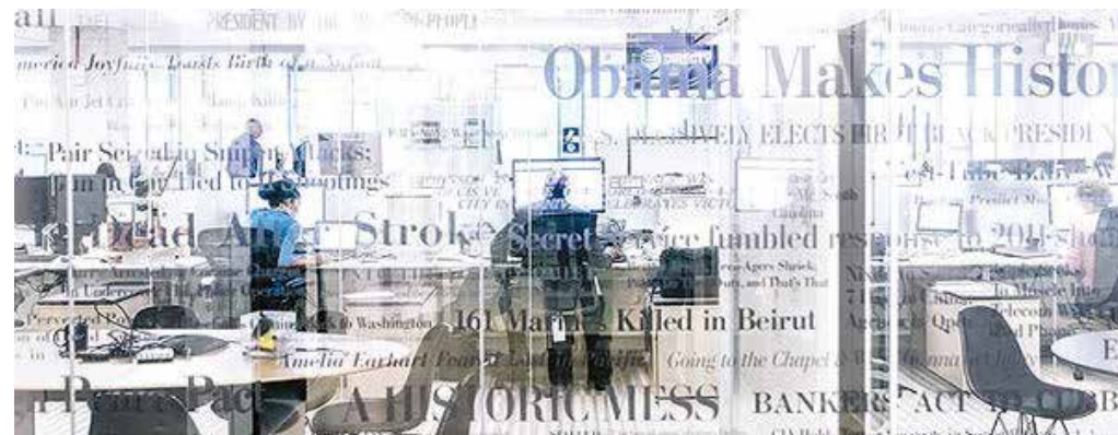
کاربرد تفکر تکنولوژیک در روزنامه‌نگاری