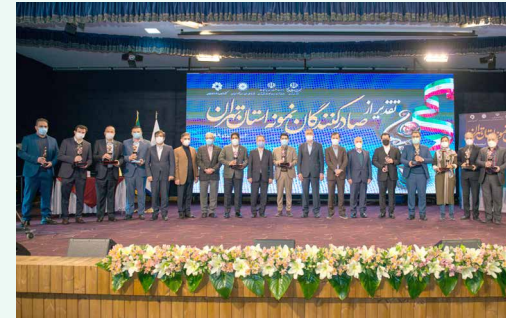
در مراسم معرفی و تقدیر از صادرکنندگان نمونه استان تهران عنوان شد