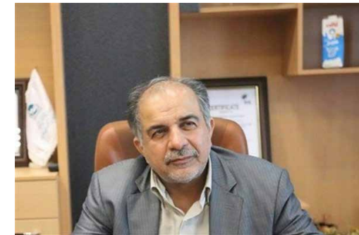
رئیس هیات عامل صندوق توسعه ملی: