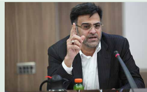
رئیس انجمن نوردکاران فولادی از "مافیای فولاد" می‌گوید