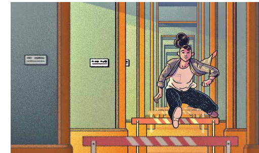
روش‌های از بین بردن اصطکاک در شرکت‌های بزرگ و پیشکسوت