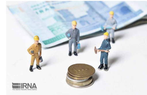
نماینده کارگران در گفت و گو با ایرنا:

وی در پاسخ به این سوال که با توجه به افزایش ۲۵ درصدی حقوق کارمندان در سال آینده، دستمزد