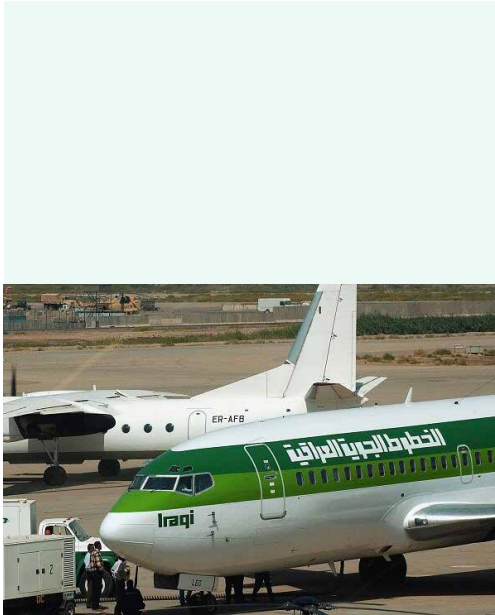
بعد از توقف یک ماهه؛