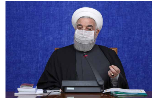
روحانی در جلسه ستاد ملی مقابله با ویروس کرونا اعلام کرد