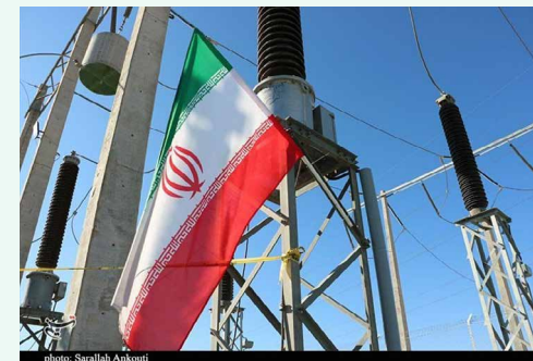
گزارش غلط معاون وزیر یا گزارش غلط به معاون وزیر؟

مشکل سوخت نیروگاه‌ها اگر ادامه دار شود، ممکن است در هفته جاری و حتی ماه جدید شاهد بازگشت خاموشی‌ها به کلانشهرها باشیم.