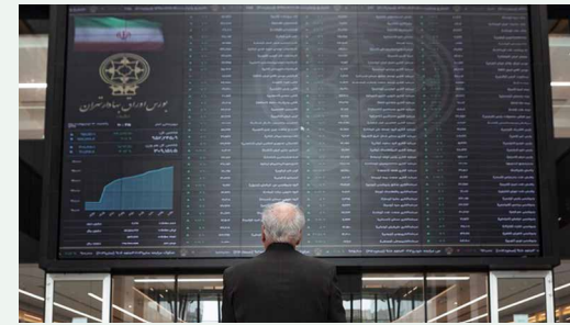
رئیس کمیسیون انرژی و محیط زیست اتاق بازرگانی تهران عنوان کرد