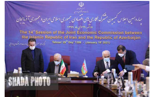
وزیر اقتصاد عنوان کرد: