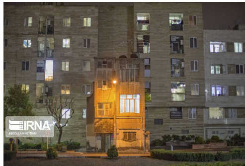
توانیر اعلام کرد: