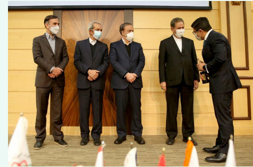
عضو هیات نمایندگان اتاق تهران و صادرکننده نمونه کشور بیان کرد