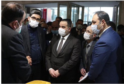
وزیر تجارت عراق تاکید کرد:

این مقام مسوول عراقی به چهارمین اجلاس همکاری‌های اقتصادی دو کشور اشاره و اظهار کرد: با توجه به روابط مهم جمهوری اسلامی ایران و عراق، هر دو کشور می‌توانند با اشتراک گذاشتن تجربیات و دانش‌های فنی خود به یکدیگر کمک کنند تا در مسائل مهم اقتصادی همکاری‌های خوبی داشته باشیم. الجبوری در پایان سخنان خود گفت: جغرافیا و جایگاه سیاسی کشورهایی که در کنار دریا ساکن هستند می‌تواند فرصت خوب و موثری برای همکاری‌های مهم و سودمند باشد. به گزارش ایرنا، صبح امروز وزیر نیرو از تلاش ایران و عراق برای رساندن سطح مبادلات تجاری دو کشور به بیش از ۲۰ میلیارد دلار در سال خبر داد. «رضا اردکانیان» افزود: رسیدن به این هدف مستلزم رفع موانع گمرکی، پولی و بانکی، حمل و نقل پول و میدان دادن به بخش خصوصی است. وی، همچنین بر رفع موانعی مانند مسایل استاندارد، گمرک، تعرفه‌های ترجیحی و سایر اقدام‌های مشابه برای رسیدن به سطح مبادلات تجاری بالای ۲۰ میلیارد دلار در سال تاکید کرد.