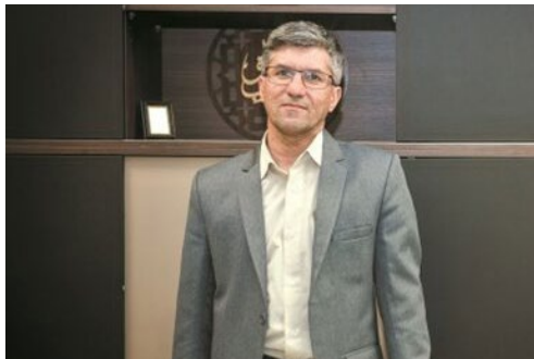
معاون فناوری بانک مرکزی خبر داد؛

وی اظهار داشت: در صورتی که تراکنش ساتنای هموطنان برگشت داده شد، می‌توانند مشکل را از طریق بانک مبدا پیگیری و بانک موظف به راهنمایی و همکاری برای حل مشکل است؛ ضمن اینکه با توجه به مهلت طولانی که برای اجرای این قانون در نظر گرفته شده بود، زمان تعیین شده تمديد نخواهد شد.