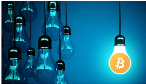
سخنگوی صنعت برق اعلام کرد: