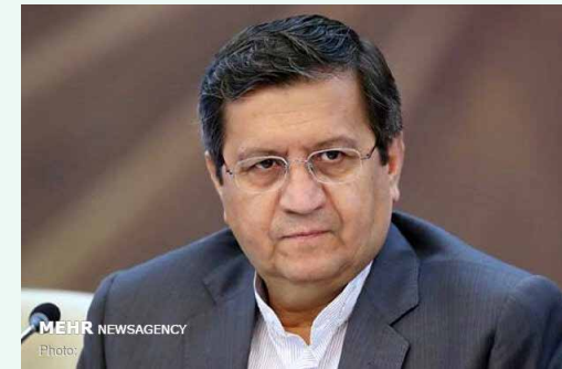
فردا انجام می‌شود؛

باشد، ما اجرا خواهیم کرد. همتی در پاسخ به سوالی درباره نظر رئیس کل بانک مرکزی درباره ارز ۴۲۰۰ تومانی افزود: پیش از این هم اعلام کرده‌ام از نظر تخصصی ارز ۴۲۰۰ تومانی را قبول ندارم. رئیس کل بانک مرکزی گفت: دولت در شرایطی که کشور دچار افزایش جدی نرخ ارز به دلیل تحریم‌های سنگین و بی‌سابقه‌ای شده بود، چاره‌ای جز تخصیص ارز ۴۲۰۰ تومانی برای تأمین داروی مردم و کالاهای اساسی و کنترل قیمت‌ها نداشت، تخصیص ارز ۴۲۰۰ تومانی در یک مقطعی بسیار خوب عمل کرد. همتی با بیان اینکه اگر همین ارزی که به خوبی اجرا و توزیع نشده را مجلس بخواهد تغییر دهد، حتماً در قیمت کالاها تأثیر خواهد گذاشت، افزود: باید به نوعی حذف ارز یارانه‌ای جبران شود. امیدواریم ارز تک نرخ شود / باید برای گرانی پس از حذف ارز ۴۲۰۰ تدبیر کرد وی گفت: بنابراین این موضوع یک تصمیم دو گانه است زیرا ارز ۴۲۰۰ تومانی از یک طرف کمک به مردم بوده و از سوی دیگر با اجرای نادرست، رانت‌هایی را به وجود آورده است. همتی ابزار امیدواری کرد: با همفکری دولت و مجلس بتوانیم معضل پیش آمده در زمینه ارز یارانه‌ای را اصلاح کنیم و به سمتی برویم که ارز، تک نرخ شود. رئیس کل بانک مرکزی با تأکید بر اینکه معتقد به ارز چند نرخ نیست، گفت: اکنون باید مراقب شوک حاصل از حذف ارز یارانه‌ای در جامعه بود و با تدبیر اقدامات لازم را انجام داد تا اتفاقی نیفتد. منابع بلوکه شده در عراق و کره / فردا با هیئت کره جنوبی دیدار می‌کنم