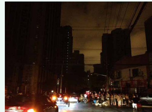
در پی سهمیه بندی برق

نگرانیهها نسبت به کمبود برق برای شهروندان عادی در دسامبر و پس از انتشار فهرست خاموشیهای