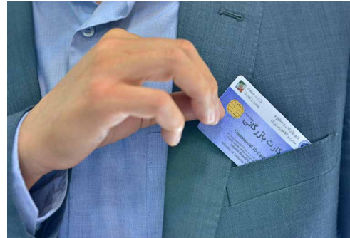
کارگروه پایش رفتار تجاری مصوب کرد

در عین حال در تبصره ۲ این مصوبه آمده است که فهرست صادرکنندگان متقاضی بند ۲ از سوی سازمان توسعه تجارت ایران به اتاق بازرگانی، صنایع، معادن و کشاورزی ایران و گمرک جمهوری اسلامی ایران منعکس می‌شود تا از صدور گواهی مبدا و انجام تشریفات گمرکی تا زمان رفع تعهد ارزی ممانعت کنند.