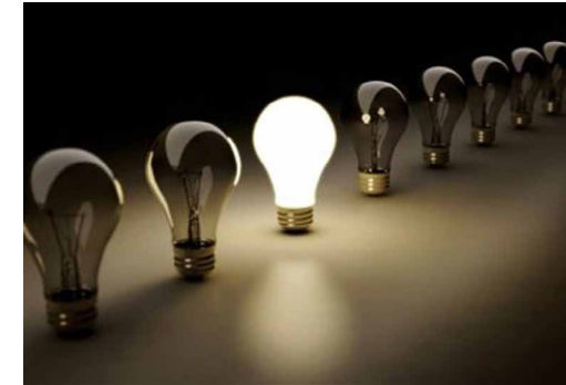
در گفت‌وگو با بورس نیوز تأکید شد:

این فعال صنعت نیروگاهی در خاتمه گفت: فعلاً خبر خاصی در صنعت نیروگاهی وجود ندارد. باید دید سرانجام لایحه بودجه ۱۴۰۰ چه خواهد شد؛ امیدواریم بودجه مناسبی برای صنعت برق در نظر گرفته شود که به مدد آن، سودآوری نیروگاه‌ها افزایش یابد.