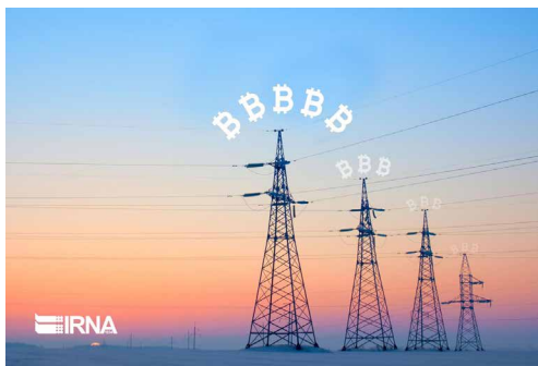
سخنگوی صنعت برق:

تداوم این شرایط موجب افزایش هزینه های اجرای پروژه ها به دلیل طولانی شدن زمان رسیدگی، نابودی شرکت های پیمانکاری متخصص در صنعت برق و افزایش چشمگیر بیکاری خواهد شد. از این رو سندیکا برای بهبود فضای کسب و کار، حفظ و ایجاد اشتغال پیشنهاد ابقا و اصلاح تبصره «۲» ماده واحده اصلاحیه تبصره «۸۰» قانون بودجه سال ۱۳۵۶ و تفویض بخشی از اختیارات شورای عالی فنی به وزارتخانه های ذی ربط بر حسب موضوع را ارائه داده است. امید آن می رود که با اضافه شدن این بند به لایحه و در نهایت قانون بودجه، حل مساله قراردادهای متوقف صنعت برق روی یک ریل قانونی، با سرعت بیشتری پیش رود.