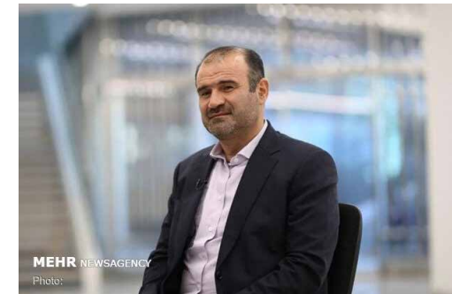
رئیس سازمان بورس:

وی اظهار داشت: سازمان بورس و اوراق بهادار در چارچوب مأموریت قانونی خود برای حمایت از سرمایه‌گذاران، موافق قیمت‌گذاری‌های دستوری، نبوده و نیست. قالیباف اصل گفت: «نهادهای بالادستی» برای مقابله با پیامدهای منفی ناخواسته، در فرآیندهای بازار رقابتی دخالت نکنند.