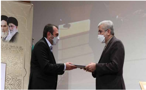
مهندس شیشه گر - شرکت سیم راد سما