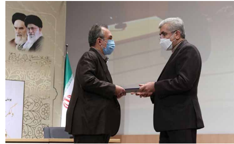
مهندس بردبار - شرکت اکترونیک افزار آزما