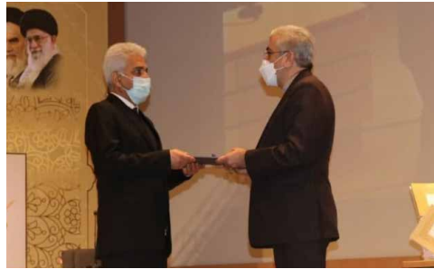
مهندس رهنما - شرکت گام اراک