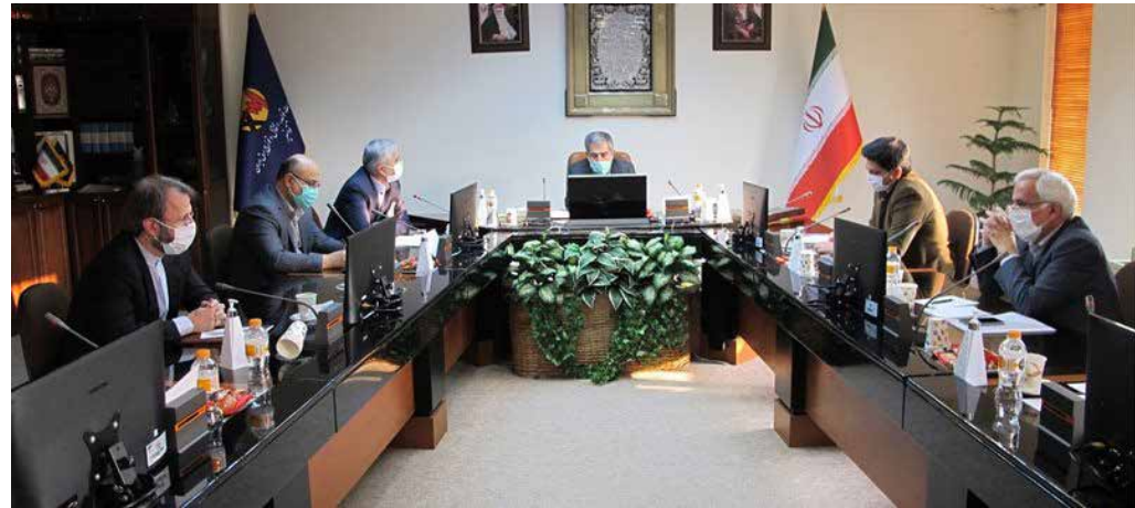
رئیس کمیسیون انرژی مجلس در نشست بررسی احکام پیشنهادی بخش برق در لایحه بودجه ۱۴۰۰ عنوان کرد: