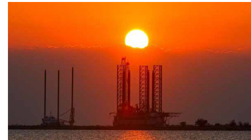
آژانس بین‌المللی انرژی: