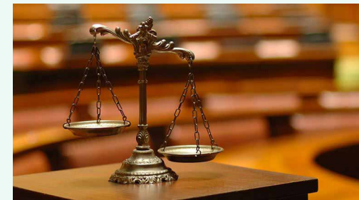
رئیس کمیسیون حقوقی و حمایت قضایی و مقرراتی اتاق ایران مطرح کرد:

ماده یک تا ۴۱ در کتاب اول، ترجمه یک متن خارجی درباره قراردادهای تجاری بین‌المللی است که با فرهنگ و نظام قضایی کشور ما تطابق ندارد و به‌طور عمده از عرف جامعه تجاری استفاده کرده است. متأسفانه این عرف در جامعه ما شناخته‌شده و قابل استناد نیست. برای مثال در یکی از مواد رفتار و تلقی طرف‌ها، به‌عنوان مبنای قرارداد در نظر گرفته شده است. بر اساس این ماده طرف‌های تجاری نباید به‌گونه‌ای رفتار کنند که طرف دیگر آن رفتار را مغایر با قرارداد تلقی کند. این مسئله در حقوق اروپا و نظام‌های حقوقی عرفی مصادیق مشخص و معینی دارد و قابل استناد است. اما مصادیق آن در جامعه تجاری و قضایی ما مشخص نیست و زمینه سوءاستفاده و کلاهبرداری را فراهم می‌کند. در کتاب اول، در موارد مختلف از عباراتی استفاده شده که مصادیق آن در جامعه ما نامشخص است و می‌تواند به دستاویزی برای کلاهبرداری تبدیل شود.