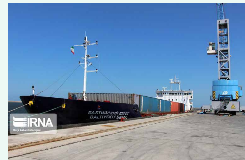
در هفت ماه ابتدایی ۹۹ ثبت شد؛

به گزارش ایرنا، وزارت صنعت، معدن و تجارت امسال رشد ۲۵ درصدی (ارزش) برای تولیدات صنایع معدنی را هدف گذاری کرده است که انتظار نمی‌رود با شرایط تحریم و کرونا این مهم محقق شود.