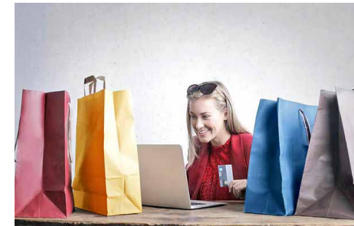
عدم آمادگی خرده‌فروش‌ها در مواجهه با پاندمی، نارضایتی مصرف‌کننده را افزایش داده است

وارتن: چه چیزی الهام‌بخش این تحقیق بود و سعی داشتید به چه پرسش‌هایی پاسخ دهید؟ رابرتسون: برنامه‌های وفاداری ۱ این روزها رواج بیشتری پیدا کرده و شاهدیم که شرکت‌ها تقریبا هر روز از برنامه‌های جدیدی رونمایی می‌کنند. شرکت‌های زیادی را می‌شناسیم که به فکر راه‌اندازی برنامه‌های وفاداری یا طراحی برنامه‌های جدیدتر هستند. اما در اینجا یک سوال مهم وجود دارد که باعث شد ما این تحقیق را انجام دهیم و آن این بود که آیا اصلا چنین برنامه‌هایی کارآیی دارند یا نه؟ موسسه مک‌کینزی مطالعه‌ای را در سال ۲۰۱۱ انجام داده بود که نشان می‌داد برنامه‌های وفاداری باعث افزایش فروش خرده‌فروش‌ها در آمریکا نشده‌اند. در واقع، خرده‌فروش‌هایی که