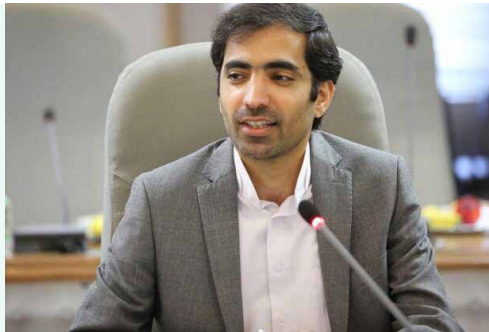
در گفتگو با مهر مطرح شد؛