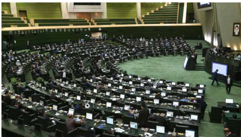
بارای نمایندگان مجلس