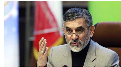
رئیس ستاد مبارزه با قاچاق عنوان کرد؛