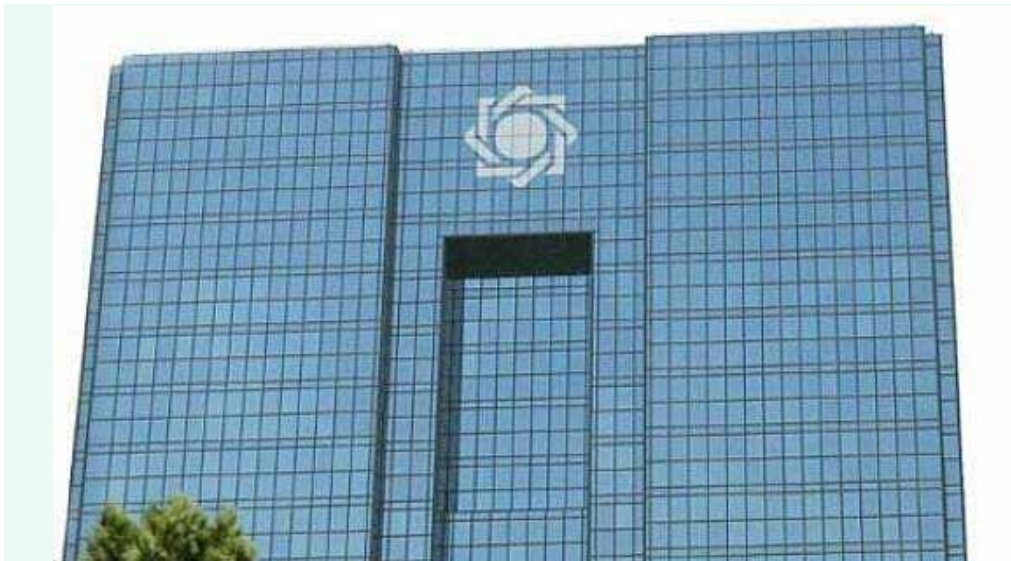
به منظور شفافیت بیشتر در تخصیص ارز؛