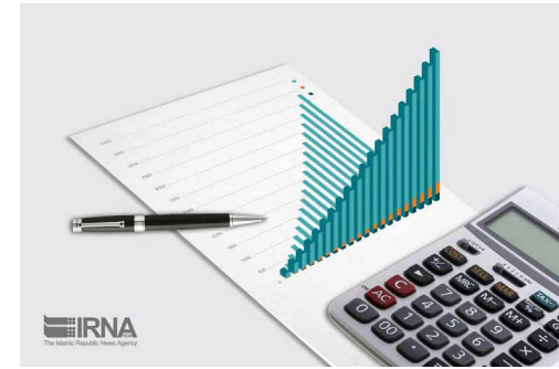
رییس سازمان امور مالیاتی تشریح کرد:

به گزارش ایرنا، با توجه به اوج‌گیری دوباره شیوه کرونا، بخش عمده مشاغل به مدت دو هفته در شهرهای دارای وضعیت قرمز تعطیل می‌شوند. برآورد می‌شود که حدود دو میلیون واحد صنفی مشمول تعطیلی اجباری شوند.