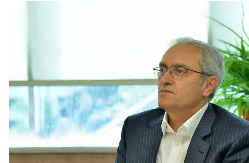
عضو هیات رئیسه اتاق بازرگانی تهران توضیح داد