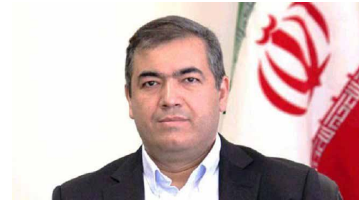
نایب‌رئیس کمیسیون کسب‌وکارهای دانش‌بنیان در گفت‌وگو با پایگاه خبری اتاق ایران

راه‌حل این مشکل چیست؟ نایب‌رئیس کمیسیون کسب‌وکارهای دانش‌بنیان اتاق ایران تأکید می‌کند: اختلاف نظرها طبیعی است اما به نظر من برای گذر از این دیدگاه سنتی، بهتر است شبکه‌سازی موثری انجام دهیم تا صنایع قدیمی از خدمات شرکت‌های دانش‌بنیان استفاده کنند. در حال حاضر