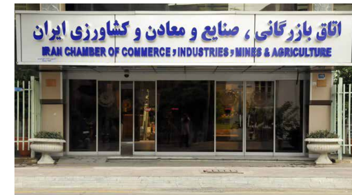
باهدف معرفی بهتر اهداف ووظایف انجام شد