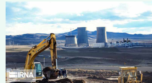
عضو کارگروه ملی ساخت داخل مطرح کرد: