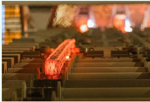
عضوانجمن فولاد در گفت و گو با مهر: