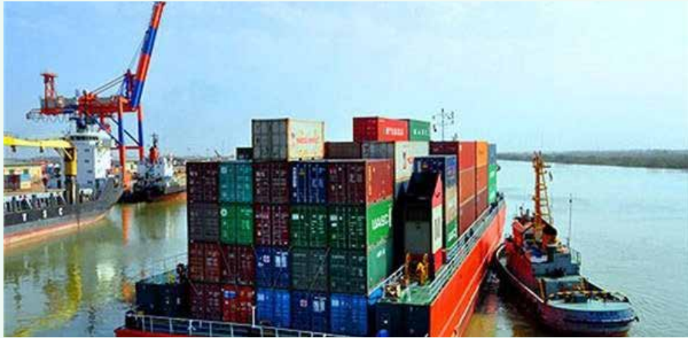
ستاد تنظیم بازار: