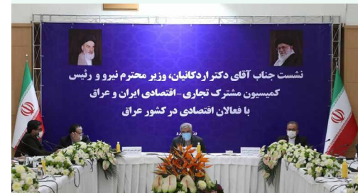
نشست وزیر نیرو با فعالان اقتصادی بازار عراق

در مورد شفافیت هم پیش بینی شده است که تمامی اطلاعات مربوط به معاملات متوسط به بالا در سامانه‌های مربوطه ثبت و به نحو مقتضی در دسترس عموم قرار گیرد. موضوع دیگر جذب نیروی انسانی و همچنین انتصاب مدیران است که متأسفانه مصادیق زیادی به لحاظ تعارض منافع در آن وجود دارد. در این مورد هم ضمن تأکید بر رعایت تعارض منافع، الزام ایجاد شده است که اطلاعات مربوط به جذب کارکنان و سایر افرادی که به روش‌های مختلف با سازمان همکاری می‌کنند در سامانه‌های مربوطه ثبت شود به نحوی که قابل رویت و پیگیری باشد. همچنین پیش بینی شده است که فرایند احراز صلاحیت و تهیه لیست‌های کوتاه برای پیمانکاران، مشاوران، و تأمین کنندگان