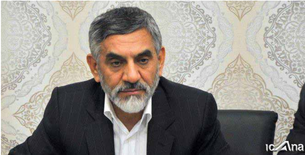
رئیس ستاد مبارزه با قاچاق کالا و ارز کشور مطرح کرد