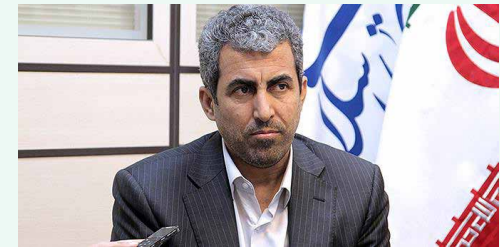
پورا براهیمی در تشریح نشست کمیسیون اقتصادی:

وی عدم وجود قانون مربوط به حوزه رمز ارزها را یکی دیگر از چالش‌ها دانست و افزود: اگر در حوزه رمز ارزها ضابطه، مبنای تصمیم‌گیری قرار گیرد، می‌توان با موارد خروج از چارچوب که به تخلفات منجر می‌شود، برخورد کرد. رئیس کمیسیون اقتصادی مجلس شورای اسلامی با بیان اینکه رمز ارزها به ضابطه‌مندی و قانونمندی نیازمند است که در حال حاضر خلاهای جدی در این حوزه وجود دارد، تصریح کرد: پس از اخذ گزارش دستگاه‌های مرتبط با رمز ارزها، در صورت نیاز می‌توان با تدوین طرح جامع رمز ارزها خلاهای قانونی را برطرف کرد.