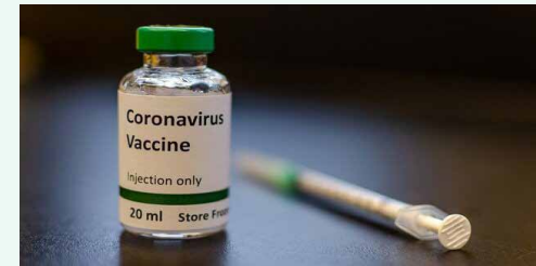
عضوهیئت‌رئیس اتاق بازرگانی تهران پاسخ داد

وی درباره محدودیت‌های موجود در مسیر تولید و عرضه واکسن کرونا، توضیح داد: در خبرها آمده که این واکسن احتمالاً دو مرحله‌ای خواهد بود، به این ترتیب، احتمالاً هر میزان دوزی که تولید شود، تنها در نیمی از همان عدد برای انسان‌ها مصونیت ایجاد می‌کند. از سوی دیگر، خطوط تولید اساساً