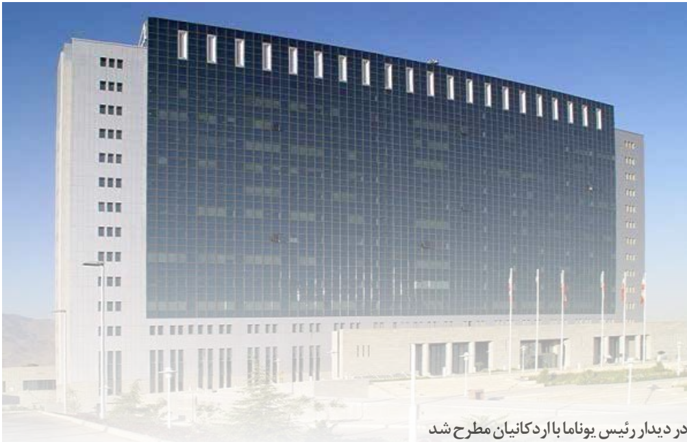
در دیدار رئیس یوناما با اردکانیان مطرح شد