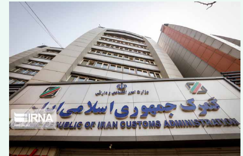
معاون فنی و امور گمرکی گمرک خبر داد: