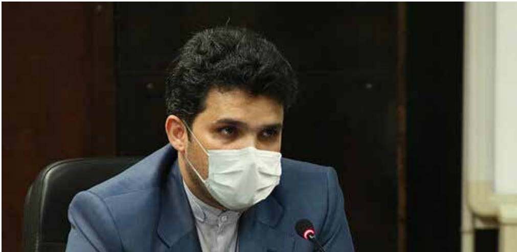
دبیر ستاد رفع موانع تولید: