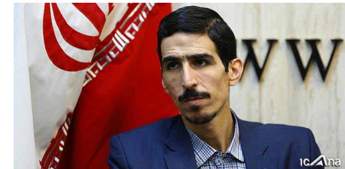
شریعتی مطرح کرد

سخنگوی کمیسیون انرژی مجلس شورای اسلامی در توضیح نحوه "تهاتر نفت با کالا"، بیان کرد: کشور در ۴ مرحله مرتبط با واردات با عنوان "فروش نفت" و "دریافت پول حاصل از فروش نفت" "پرداخت پول برای وارد کردن کالا" و "وارد کردن کالا" مشکل دارد لذا با توجه به این مشکلات باید مرکزیتی توسط یک فرد و مجموعه خاص ایجاد شود به این شکل که یک شرکت خارجی (با نقش واسطه‌ای) کالای مورد نیاز ما را تحویل داده و در مقابل نفت دریافت کند. باتوجه به اینکه تاکنون فروش نفت بر عهده وزارت نفت و واردات کالا بر عهده وزارت صمت بوده است باید یک مجموعه یا فرد تصمیم‌گیر برای انجام این کار مشخص شود لذا به مجموعه تصمیم‌گیرنده این مهم پنجره واحد گفته می‌شود.