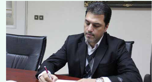
نایب رئیس هیات مدیره سندیکای برق ایران به ایراسین گفت:

وی تصریح کرد: این واقعیت نشان می‌دهد در این زمینه بسیار عقب هستیم و باید توجه داشته باشیم که این عقب افتادگی در سایر بخش‌ها خودنمایی خواهد کرد و بعضاً می‌تواند توسعه کلان را با چالش روبرو کند، چون انرژی برق پیش نیاز است.