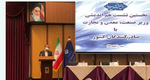
وزیر صنعت، معدن و تجارت:

رزم حسینی تصریح کرد: در این شیوه نامه پیش بینی شده است که مباحث تعهدات ارزی اقلام کالایی گروه‌های ۲ و ۳ همانند گذشته با بانک مرکزی خواهد بود و تخصیص ارز نیز از این مسیر