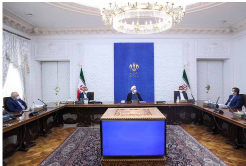
دکتر روحانی در جلسه ستاد هماهنگی اقتصادی دولت:

رئیس جمهور تصریح کرد: نوسانات اخیر برخی از اقلام اساسی مانند گوشت قرمز ناشی از برخی ناهماهنگی ها در شبکه تامین و توزیع است و باید هرچه زودتر چنین مشکلاتی توسط وزارت صمت و وزارت جهادکشاورزی برطرف شود. سایر دستگاه های مرتبط نیز موظفند در تنظیم بازار با وزارت صمت هماهنگی و همکاری لازم را داشته باشند.