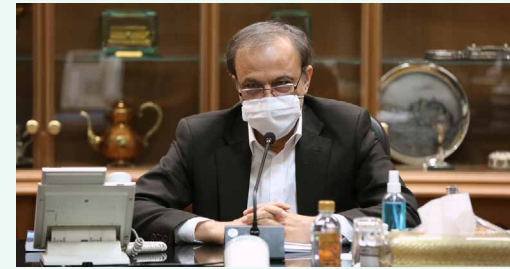
وزیر صمت در نشست صمیمی بافراکسیون تشکل‌های اتاق ایران تاکید کرد: