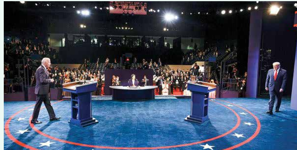
انتخاباتی که فقط با دو مناظره به پایان می‌رسد