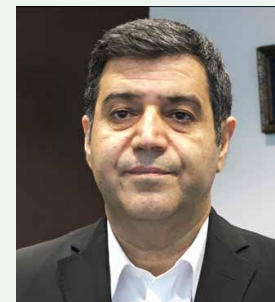
حسین سلاح‌ورزی؛ نایب‌رئیس اتاق ایران

ارز در صورت تصویب نهایی، فرآیند بازگشت ارز را تسریع و تکمیل می‌کند. او هم‌چنین در مورد صادرکنندگان کارتن خواب که توسط رئیس کل بانک مرکزی بیان شده این پرسش‌ها را مطرح کرد که این افراد قبل از دریافت کارت بازرگانی، چگونه حساب بانکی افتتاح کرده، کد مالیاتی و کد بیمه تامین اجتماعی دریافت کرده‌اند و چرا کسی از هویت بیش از ۱۲ هزار صادرکننده بدون کارت بازرگانی سخنی نمی‌گوید؟