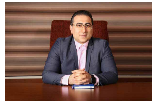
رئیس اتاق مشترک ایران و امارات در «روز ملی صادرات» عنوان کرد

وی با بیان اینکه طی سال‌های گذشته، سرمایه‌گذاری عظیمی در امارات در زمینه‌های ترانزیت و لجستیک، ارتباطات و فناوری صورت گرفته و دولت این کشور، استراتژی تجاری خود را روی ارائه خدمات به چهار پایتخت تهران، ریاض، دهلی‌نو و کراچی بنا کرده‌است، افزود: متأسفانه به دلیل تحریم‌ها، ایران از قافله تجارت برد-برد با