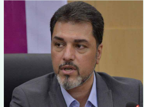
نائب رئیس سندیکای صنعت برق ایران در گفت و گو با «تهران نیوز»

نائب رئیس سندیکای صنعت برق ایران تصریح کرد: صنعت برق در کشور یک صنعت مادر است و باید برای رشد و توسعه آن به این صنعت کمک شود تا سایر صنایع وابسته به صنایع برقی هم رشد کنند که توام با رشد آن ها شاهد توسعه پایدار در اقتصاد کشور خواهیم بود.