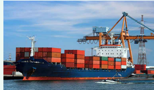
عضو هیات نمایندگان اتاق بازرگانی تهران در آستانه «روز ملی صادرات» عنوان کرد

او با بیان اینکه موضوع عدم ثبات در قوانین است، یکی دیگر از چالش‌های صادرات در ایران است، افزود: به دلیل مشکلاتی که در اقتصاد ما پیش آمده است، نتوانستیم یک چهره حرفه‌ای صادراتی را در سطح جهان به نمایش بگذاریم. یکی از این مشکلات نبود ثبات در مقررات است. تصور کنید در مواردی، صادرکنندگان توانسته‌اند بازاری را در رقابت با رقبای خود تصاحب کنند اما زمانی که خواستند این