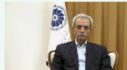
پیام غلامحسین شافعی رئیس اتاق ایران به مناسبت روز ملی صادرات

در شرایطی که تحریم‌های ناجوانمردانه علیه اقتصاد ایران، شرایط را برای تامین منابع ارزی دشوار ساخته است، اهمیت صادرات غیرنفتی به عنوان بزرگترین منبع تامین‌کننده ارز در کشور دو چندان جلوه می‌کند از همین رو نیاز به حمایت‌های بیشتر