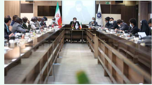
در نشست هیات کنیایی با فعالان اقتصادی ایرانی مطرح شد