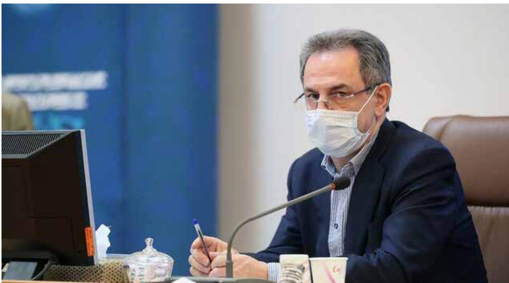
استاندار تهران تاکید کرد: