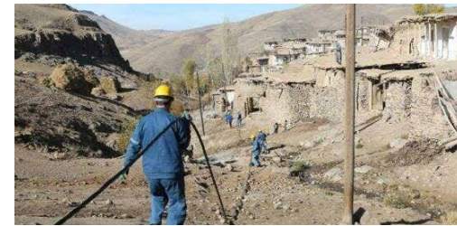
سخنگوی صنعت برق:

محمدباقر نوبخت، رئیس سازمان برنامه و بودجه کشور بخشنامه دستورالعمل نحوه محاسبه تفاوت بهای فلزات در کارهای فاقد تعدیل و مابه التفاوت مصوب ۸ بهمن سال ۱۳۹۲ را طی ابلاغیه ای فاقد اعتبار اعلام کرد. براین اساس و با به استناد ماده ۲۳ قانون برنامه و بودجه و ماده ۳۴ قانون احکام دائمی برنامه های توسعه کشور موضوع نظام فنی و اجرایی یکپارچه و نیز پیرو ابلاغ فهرست بهای واحد پایه رسته نیرو سال ۹۹، بخشنامه دستورالعمل نحوه محاسبه تفاوت بهای فلزات در کارهای فاقد تعدیل و مابه التفاوت مصوب ۸ بهمن سال ۹۲ از تاریخ اول آبان سال ۹۹ فاقد اعتبار است.