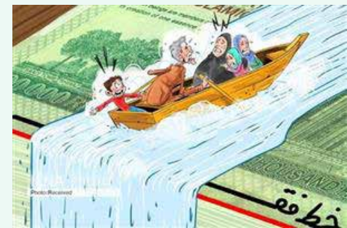
عضو اتاق بازرگانی در گفت و گو با نوآوران عنوان کرد:

در حال حاضر با توجه به فشارهای خارجی باید راهی برای اعتماد زایی در جامعه ایجاد شود تا روند اعتمادزدایی تداوم نیابد. به‌ویژه در شرایط کنونی که گذر از بحران‌ها مستلزم حمایت‌ها و پشتوانه‌های مردمی است باید اعتماد مردم جلب شود.