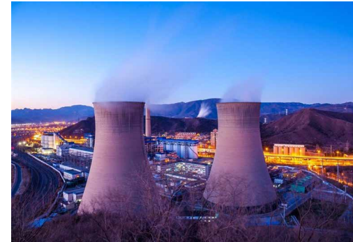
ساختار حکمرانی صنعت برق کره جنوبی (۲)