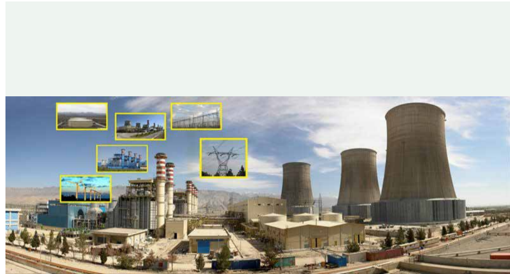
معاون برنامه ریزی شرکت برق حرارتی:

عضو هیات مدیره سندیکا در یادداشتی نوشت: گرفتن بازارهای دنیا برای تولید نقطه عطف است و اگر کشوری بخواهد تولید را رقابتی کند تا چرخ آن بچرخد باید بازار بزرگ با تیراژ بالا داشته باشد ولی نباید متکی به بازار داخل کشور باشد. امروز در دنیا کشوری نمی تواند دور خودش دیوار بکشد و بخواهد به تنهایی تولید رقابت پذیر داشته باشد. گرفتن بازارهای دنیا برای تولید نقطه عطف است و اگر کشوری بخواهد تولید را رقابتی کند تا چرخ آن بچرخد باید بازار بزرگ با تیراژ بالا داشته باشد ولی نباید متکی به بازار داخل کشور باشد و به همین دلیل هم باید بتوانیم روابط بسیار خوبی حتی با همسایگان مان که بازار خوب منطقه ای هستند یا کشورهای مسلمان که می توانند رابطه خوبی با ما داشته باشند، داشته باشیم. از این رو باید سیاست های تنش زدایی را دنبال و کاری کنیم که روابط بین الملل ایران با جهان بهبود یابد، ارتباطات نقش اصلی را در این زمینه بازی می کند. از همه مهمتر این است که زیرساخت اقتصادی ایران باید از حالت ممیزی خارج و به شکل اقتصاد پویا درآید و دولت باید نقش