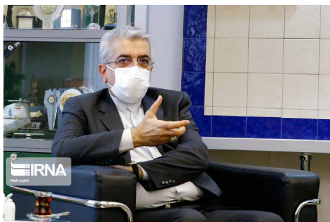
وزیر نیرو در گفت‌وگو با ایرنا اعلام کرد:

هرمزگان هم اکنون دارای سه نیروگاه تولید برق است که با بهره برداری از نیروگاه سیکل ترکیبی بندرعباس و نیروگاه سیریک تعداد آنها به پنج واحد افزایش می‌یابد.