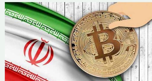
مدیرعامل شرکت برق حرارتی خبر داد:

وی خاطر نشان کرد: درصددیم که درآمد حاصل از این بخش در جهت نوسازی و بهسازی نیروگاه‌ها مورد استفاده قرار گیرد.