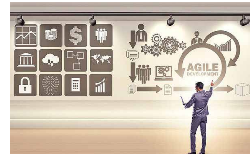
جسارت و تنوع بخشی دو عامل ورود سازمان به حوزه‌های سودآورتر