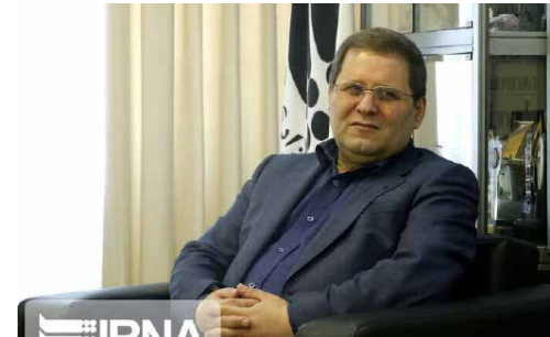
مدیرعامل بانک صنعت و معدن: