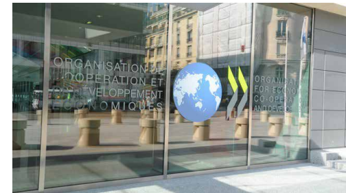
سازمان همکاری و توسعه اقتصادی (OECD) گزارش می‌دهد

SME‌ها برای دسترسی به منابع استراتژیک، از جمله مهارت‌ها، امور مالی و دانش با موانع زیادی روبرو هستند. ۲۵ درصد از شرکت‌های کوچک و متوسط در اتحادیه اروپا، مهم‌ترین مشکل خود را کمبود نیروی ماهر یا مدیران باتجربه گزارش کردند