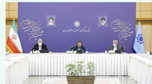
در نشست هیات رئیسه اتاق ایران و فعالان بخش خصوصی با رئیس کل بانک مرکزی

شافعی، رئیس اتاق بازرگانی، صنایع، معادن و کشاورزی ایران در این نشست با بیان اینکه صادرکنندگان متعهد دلیلی برای عدم رفع تعهد صادراتی‌شان ندارند تأکید کرد: درک متقابل مشکلات بانک مرکزی و صادرکنندگان توسط طرفین برای گذر از شرایط سخت کشور ضروری است و برگزاری چنین جلساتی به افزایش این همگرایی کمک می‌کند. رئیس کل بانک مرکزی هم در این دیدار، ضمن قدردانی از عملکرد اتاق بازرگانی، صنایع، معادن و کشاورزی ایران و فعالان اقتصادی در بازگشت ارزهای صادراتی به بررسی و مرور مشکلات آنان در این مسیر پرداخت. عبدالناصر همتی تأکید کرد که بانک مرکزی تعامل با صادرکنندگان را در دستور کار دارد و از هرگونه همکاری با آنان در راستای بازگشت ارزهای صادراتی‌شان دریغ نخواهد کرد. همتی با بیان اینکه صادرکننده‌ها نقشی اساسی در مقاومت اقتصادی کشور ایفا کرده و می‌کنند، بر ضرورت همدلی و تلاش جمعی صادرکننده‌ها برای عبور از شرایط سخت کنونی کشور تأکید کرد. همتی با اشاره به تعدد وظایف بانک مرکزی، تأمین ارز کالاهای اساسی، دارو و مواد اولیه را اولویت اصلی بانک مرکزی دانست و گفت: باید توجه داشته باشیم که بانک مرکزی تولیدکننده ارز نیست و به‌هرحال ناچار به اولویت‌بندی نیازهای کشور است. رئیس کل