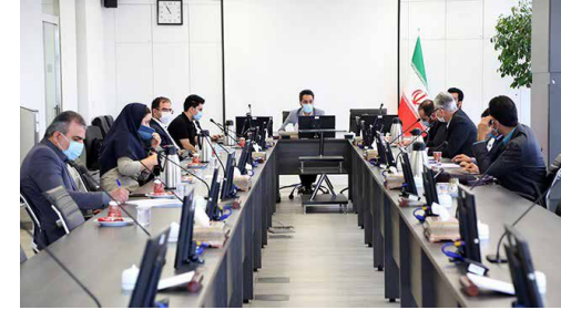
در نشست کارگروه تخصصی شورای گفت‌وگو تأکید شد

عامری افزود: بدین ترتیب بسیاری از مشکلات واردکنندگان با این مصوبه تسهیل شد و گمرکات اجرایی با استناد به مصوبه ستاد مقابله با تحریم شورای عالی امنیت، پس از حصول اطمینان از