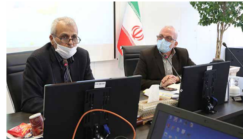
رئیس مرکز پژوهش‌های اتاق ایران در نشست شورای راهبردی بهبود محیط کسب و کار

وی بیان داشت: براین اساس صادرکنندگانی که نسبت به رفع تعهد ارزی اقدام کنند و ارز حاصل از صادرات را به کشور بازگردانند با دادن مشوق‌های صادراتی، مورد تشویق سازمان توسعه تجارت قرار خواهند گرفت.