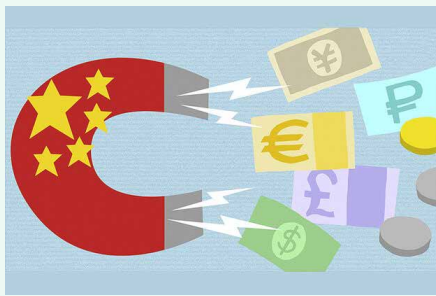
سخنگوی صنعت برق خبر داد