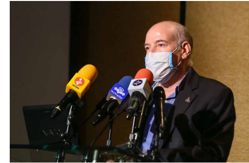
معاون وزیر نفت در امور گاز اعلام کرد

معاون وزیر نفت در امور گاز گفت: تاکنون حدود هزار و ۳۵۵ میلیارد تومان در استان کرمانشاه در بخش گازرسانی هزینه شده و ۳۰۰ میلیارد تومان هم پروژه جاری است و تلاش می‌شود مابقی منابع استان هم بدون محدودیت به‌طور حتم تأمین شود. تربتی با اشاره به پویش استان سبز در کشور، تصریح کرد: امسال ۲۲ استان کشور با ۹۵ درصد بهره‌مندی سبز شدند و این روند تا پایان امسال ادامه دارد. با این روند تا پایان امسال ۳ هزار روستا و سال آینده هم ۳ هزار روستای دیگر گازرسانی می‌شوند که با توجه به اینکه کلنگ همه آنها زمین زده شده هیچ‌کدام برنامه نیست و همگی در حال اجرا هستند، بحث گازرسانی به روستاها که رئیس‌جمهوری از آن با عنوان انقلاب گازرسانی یاد کردند ادامه می‌یابد و در پایان دولت خبرهای خوبی خواهد داشت.