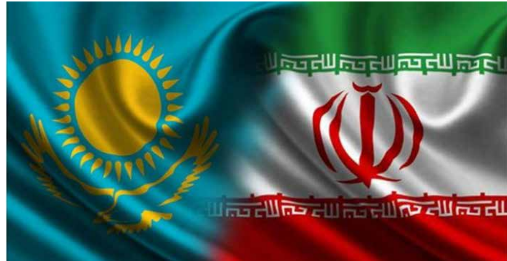
دبیر میز قزاقستان تشریح کرد:

از آنجاکه شرکت‌های تولیدکننده این محصولات یکی از دلایل اصلی عرضه ارزان‌تر مواد اولیه تولید داخل در بازارهای خارجی را معافیت‌های مالیاتی عنوان می‌کردند انتظار می‌رود با تصویب این طرح و اجرایی شدن آن این بهانه رفع شود و در ادامه شاهد افزایش تمایل این مجموعه‌ها برای تامین نیاز بازار داخل باشیم. کلاهی افزود: درحال حاضر برخی مواد اولیه و محصولات میانی بیش از نیاز کشور در بازار داخل تولید می‌شود و باید صادر شود و صنایع پایین‌دستی نیز مخالف این امر