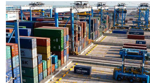
معاون فنی گمرک ایران مطرح کرد

او اظهار کرد: باید توجه داشت ترخیص کالاهای اساسی وارداتی که دارای ثبت سفارش و قبض انبار تا تاریخ ۲۰ تیر ۹۹ باشند، به‌صورت اعتباری سه‌ماهه به تشخیص وزارت صنعت، معدن و تجارت امکان‌پذیر است و بانک مرکزی نسبت به تعهد تأمین ارز کالاهای اساسی گروه یک، به نرخ رسمی ظرف سه ماه آینده اقدام کرده است.